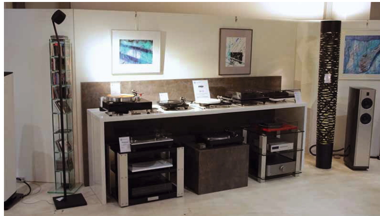
Der analoge Anteil kommt beileibe nicht zu kurz: Plattenspieler aller Gewichtsklassen in der Vorführung

interessierten Kunden Anlagen und Komponenten vorführen. Um eines der Kaliber zu nennen, mit denen man hier arbeitet: Coldewey ist der führende Burmester-Händler im ganzen Norden – sicherlich nicht etwas, das man erwartet, wenn man über die normale Verkaufsfläche mit Gasgrills und Kaffee-Vollautomaten ins Sinnwerk abbiegt, das auf einer Fläche von 200 Quadratmetern diverse liebevoll gestaltete Hör-Ecken anbietet, in denen verschiedene kompetent zusammengestellte Anlagen die Ohren verwöhnen. Zuletzt konnte man das Lautsprechersortiment um die edlen und wundervoll verarbeiteten Sonus-Faber-Boxen ergänzen. Neben der Vorführung in den Räumen des Sinnwerks hat der Kunde ganz im Sinne der serviceorientierten Coldewey GmbH auch immer die Möglichkeit, in seinen eigenen Räu-