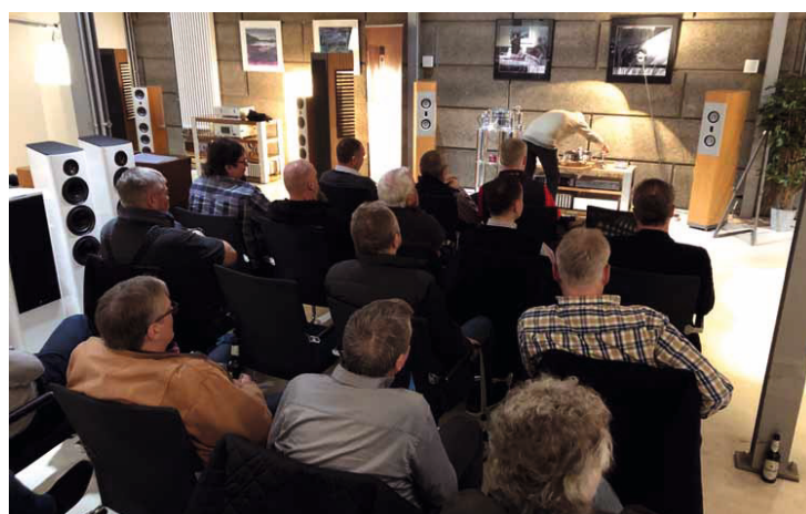
Beim Tag der offenen Tür gibt es natürlich auch jede Menge Workshops, bei denen Vertreter der Marken ihre Neuheiten präsentieren