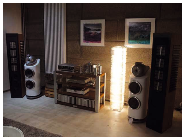
Ganz selbstverständlich und einträchtig stehen im Sinnwerk Referenzboxen von B&W und Piega nebeneinander