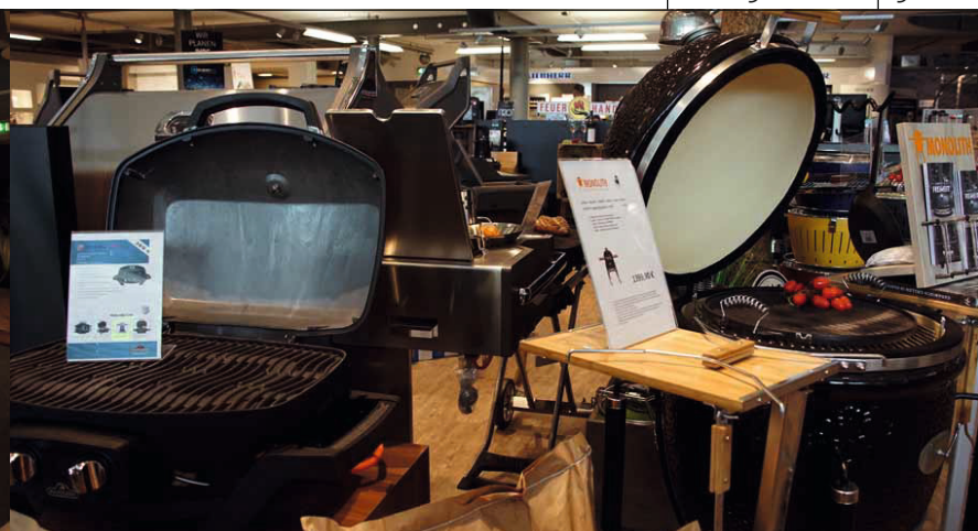
Coldewey ist wirklich ein Vollsortimenter – der Weg zu den höheren Audioweihen führt immer vorbei am gehobenen Grillen