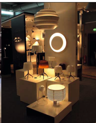
Auch in der Lampenabteilung Coldeweys kann man sich für eine ganze Weile verlieren