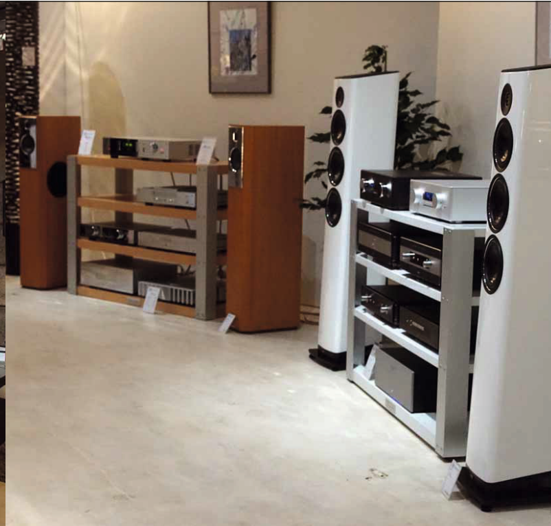
Auch gestalterisch merkt man die kompetente Hand des Teams im Sinnwerk

interessierten Kunden Anlagen und Komponenten vorführen. Um eines der Kaliber zu nennen, mit denen man hier arbeitet: Coldewey ist der führende Burmester-Händler im ganzen Norden – sicherlich nicht etwas, das man erwartet, wenn man über die normale Verkaufsfläche mit Gasgrills und Kaffee-Vollautomaten ins Sinnwerk abbiegt, das auf einer Fläche von 200 Quadratmetern diverse liebevoll gestaltete Hör-Ecken anbietet, in denen verschiedene kompetent zusammengestellte Anlagen die Ohren verwöhnen. Zuletzt konnte man das Lautsprechersortiment um die edlen und wundervoll verarbeiteten Sonus-Faber-Boxen ergänzen. Neben der Vorführung in den Räumen des Sinnwerks hat der Kunde ganz im Sinne der serviceorientierten Coldewey GmbH auch immer die Möglichkeit, in seinen eigenen Räu-