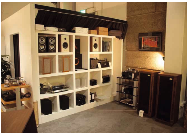
Wenn die vorhandene Vorführung nicht ausreicht, zieht man eben noch ein paar Boxen aus dem Regal