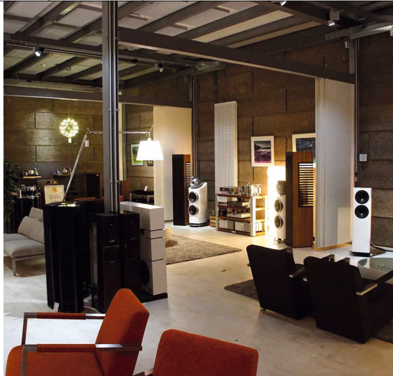
Das Sinnwerk – hier ein kleiner Ausschnitt – bietet zahlreiche Hörnischen, die bei Bedarf sogar abgetrennt werden können