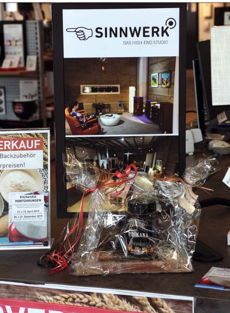
Kleiner Hinweis – großer Sound: Im großen Laden findet sich der dezente Hinweis auf die Oase besten Klangs