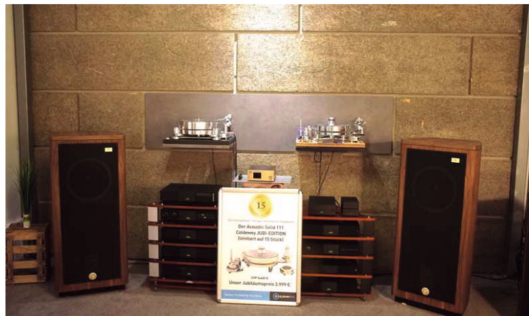
(Fast) rein britisch ist diese Anlage mit Naim und Tannoy – ergänzt durch zwei Großkaliber aus dem Hause Acoustic Solid